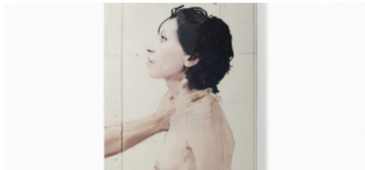
'Cuerpos y flores', el primer libro de artista de Antonio López.