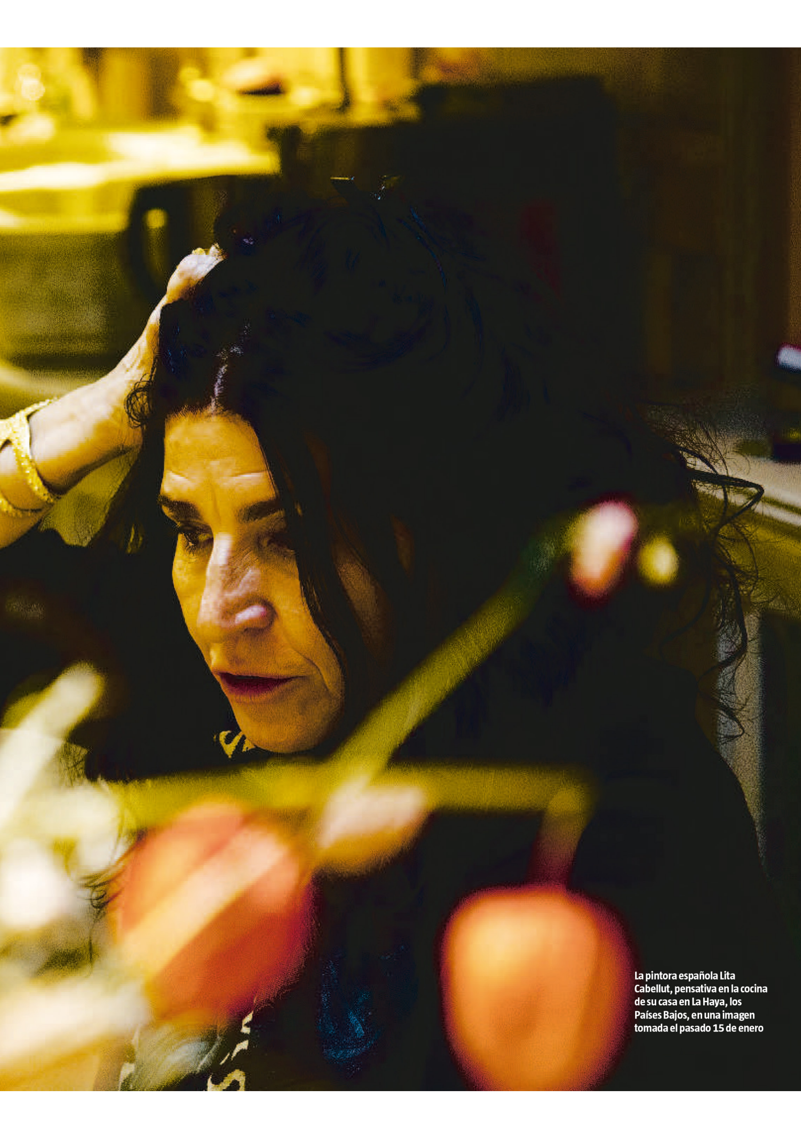
La pintora española Lita Cabellut, pensativa en la cocina de su casa en La Haya, los Países Bajos, en una imagen tomada el pasado 15 de enero