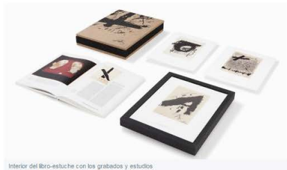
Interior del libro-estuche con los grabados y estudios

Contar algo novedoso sobre Tàpies , uno de los más relevantes pintores del siglo XX, resulta harto difícil. Y aparecer con una obra nueva bajo el brazo , más aún. En los próximos días se publica (la editorial Artika) una edición de lujo con su «Serie Negra». Un conjunto de 15 estampas, aunque hasta ahora sólo se tenían localizadas catorce de ellas. La última, la que cierra este círculo estaba perdida en casa del artista y aparece por primera vez en este libro conmemorativo, que más que libro es una obra de arte, a la que casi da miedo tocar. El tamaño del mismo hace que parezca casi una escultura, en cuyo interior se esconde toda la intensidad de este trabajo que nos muestra el Tàpies más íntimo y experimental con el dibujo y con el papel .