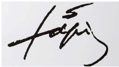
La firma de Tàpies en la «Serie Negra»

Cuenta el hijo de Tàpies que su padre siempre tuvo un especial interés y sensibilidad por el dibujo desde sus comienzos como artista, siendo el papel el soporte que más empleó en aquel tiempo no solo porque era más accesible sino también porque la unión de este material con el grafito, el lápiz y la tinta resulta perfecta, de matices intensos y exquisitos. En el caso de la «Serie Negra», el papel es el de estraza, cuyo tacto y rugosidad confieren una lectura muy especial a esos trazos tan característicos de Tàpies.