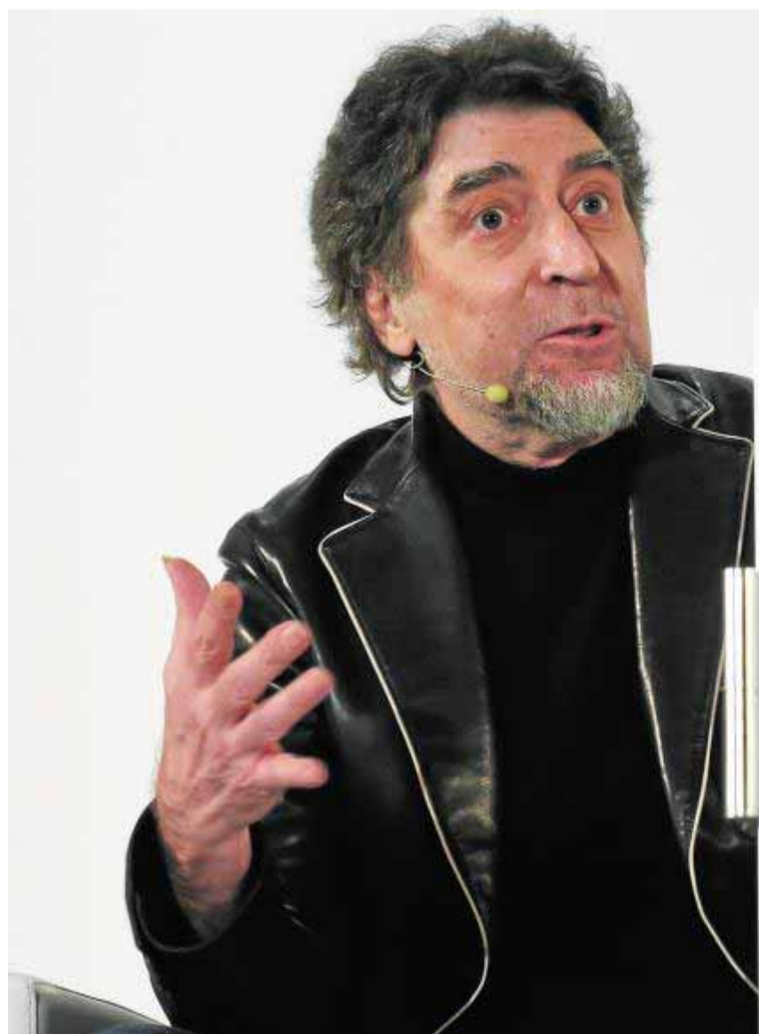
Joaquín Sabina, en la presentación ayer en Madrid de su nuevo trabajo 'Garagatos'.

Mercado. La baja producción de aceites lampantes dispara su precio a 3,20 euros por kilogramo P9