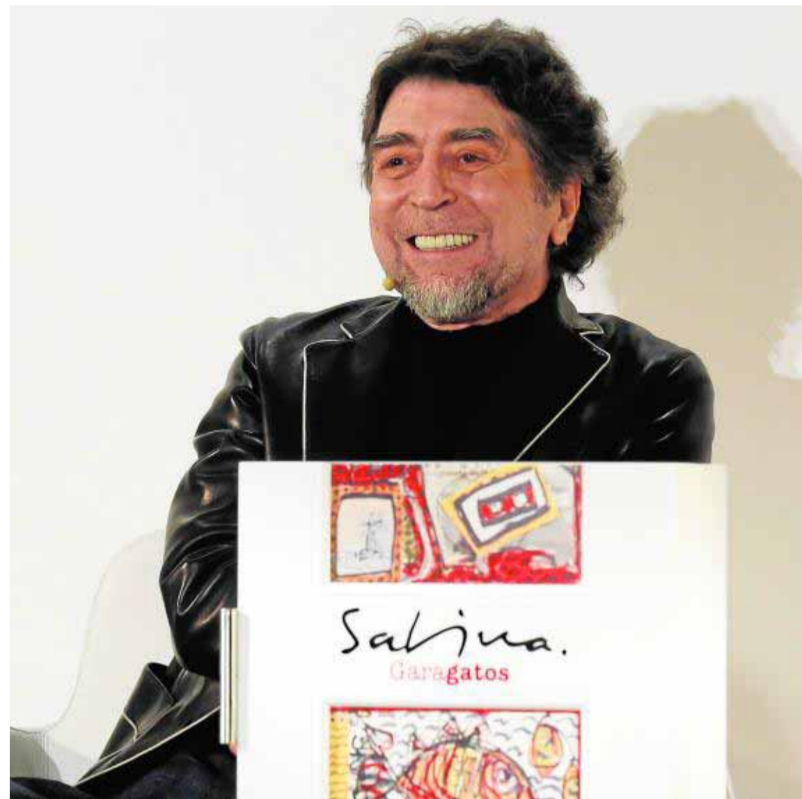
Joaquín Sabina, durante la presentación de su libro 'Garagatos'.

«Quiero que mis niñas, que piensan que soy un cantante horrible, empiecen a creer que soy Picasso. Y también para competir con Luis 'Leonardo' Aute, que siempre ha ido de pintor», dijo el artista en tono de broma.