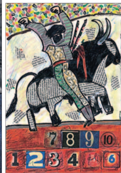
Pongamos que hablo de Madrid.