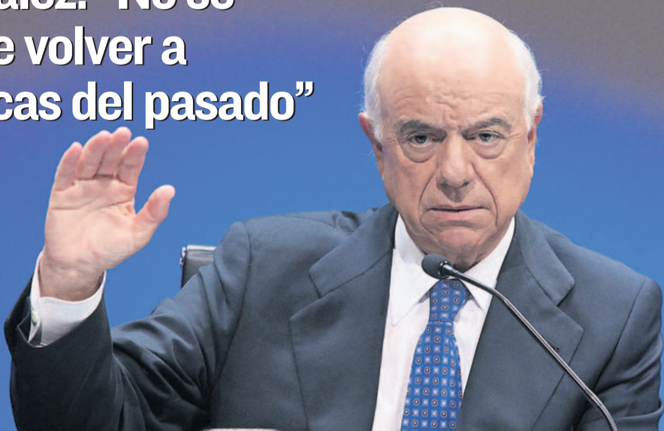
El presidente de BBVA, Francisco González, ayer, en la presentación de resultados.