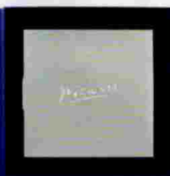
100% ARTIKA Homenajes a Chillida, Miró, Gaudí, Sorolla, Barceló y Picasso.

f rente a sus esculturas públicas en espacios abiertos —el aspecto más conocido de su trabajo—, esta obra es menor en tamaño pero de carácter más íntimo. ¿A qué escala resulta más difícil desnudarse? «Siempre he creído que el arte está muy relacionado con la idea de escala. Una galería es una manera más íntima de relacionarse que una intervención en un espacio público, aunque en éste las obras sean más mediáticas. En esta publicación creo que se ha logrado unir el aspecto más íntimo con imágenes de instalaciones que representan el lado más público; el de mi interés por la comunidad y por introducir belleza en la vida de la gente. Pero cuesta desnudarse en ambos. Es como cuando te miras al espejo, que no te perdonas nada. Pero si el arte tiene algún valor, es que sea muy sincero y que no te dé miedo mostrarte. No puedes ser más alto o más bajo; eres ».