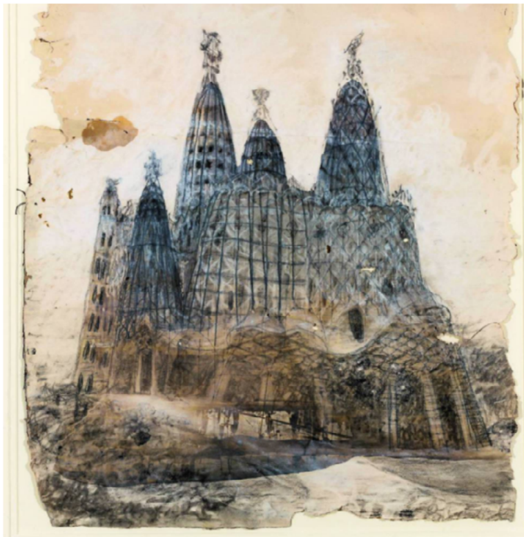
Projecte per a la capella de la Colònia Güell, que mai es va construir. ARTIKA

S'han escrit oceans sobre el personatge, el marxandatge a què va donar lloc el seu univers estètic és inacabable, no hi ha referències clares de comparació o equiparació entre la seva obra i la d'altres grans arquitectes de la història, i turistes de tot el món continuen amuntegant-se (o millor, continuaran amuntegant-se, amb vacuna) davant de criatures seves com la Sagrada Família, el parc Güell, la Pedrera o la Casa Batlló, totes a Barcelona i totes declarades ja fa anys patrimoni de la humanitat per la Unesco.