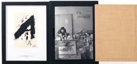
El papel usado es de alto gramaje.

ellas es única e irrepetible, ya que la técnica usada por Tàpies hace casi imposible que dos trazos sean nunca iguales. De hecho, según cuenta su hijo Antoni Tàpies Barba en una entrevista, el artista tuvo un interés especial toda su vida por el dibujo, usando en sus comienzos el papel como soporte, por ser un material fácil de encontrar, además de ser perfecto para el grafito, el lápiz o la tinta. El uso del papel, y más concretamente el de estraça para su Sèrie negra , supuso un intento por parte del genio de demostrar que los materiales más humildes pueden valer como soporte del arte.