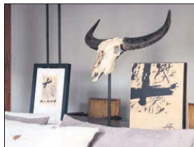
El estuche está forrado con tela de arpillera natural, un guiño a los materiales que usaba el artista.

por artistas que él admiraba. En la Sèrie negra hay tres tipologías de obras: dibujos de letras y signos y una serie de monocromos negros y blancos. La variedad de intensidades en la aplicación del negro a través de tres técnicas diferentes en esta obra ( frottage , pincelada y salpicadura), favorece la aparición de efectos lumínicos, confiriéndole un aspecto más ilusionista.