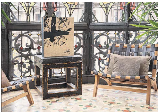
Obra de la Sèrie negra de Tàpies, editada por Artika.

La edición se presenta en un estuche de gran tamaño, fabricado en madera forrada de tela arpillera, con trazos del artista impresos en serigrafía, siguiendo un proceso artesanal, que reproduce fielmente cada detalle del original. Todas y cada una de las piezas que la componen están elaboradas de forma individual. En el interior descansan la serie completa de las láminas a una sola tinta, la negra. Cada una de